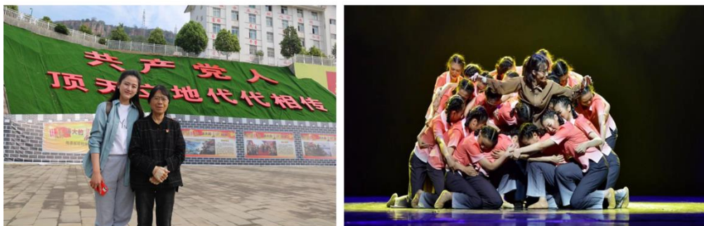
图片 2 跨专业联合实践中编创舞蹈《我的妈妈叫桂梅》，入选第 16 届云南省新剧目展演

学院领导认为，“跨专业联合实践教学”应凸显学校“应用型、地方化、个性化、国际化”发展战略，积极履行高校社会服务职能，拓展社会服务领域，满足间接客户需求。师生应在跨专业联合实践中投身地方经济社会发展。由此，确立了“艺术·为人民服务”的实践教学品牌架构，以公益性、开放性、实用性作为开展跨专业联合实践教学的原则。