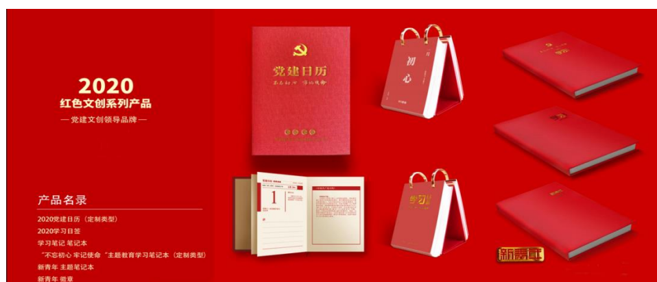
图片 5 教师与企业导师联合开展跨专业联合实践教学指导，将作品变为产品

2018 年至 2020 年，“跨专业联合实践教学”已实现了专业群内的落地实施。2021 年至今，学院通过课程联合方式实现跨专业群的“跨专业联合实践教学”工作探索。