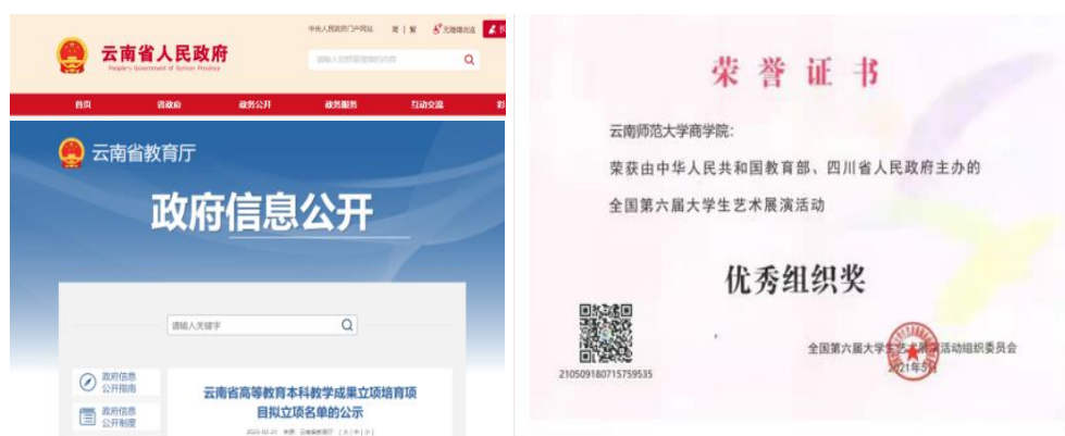
图片 8 教学团队累计获国家级表彰及奖励 14 项、省级表彰及奖励 33 项。获国家级课题立项 5 项，省级课题立项 5 项

2017 年，获云南省人民政府颁发的“云南省高等教育教学成果奖”二等奖。2018 年，在第五届全国大学生艺术展演中获教育部颁发的“优秀组织奖”。2019 年，跨专业联合实践教学团队获得云南省人社厅、云南省教育厅联合颁发的“云南省教育系统先进集体”。2020 年，与云南省教育厅联合制订云南中考美育改革方案。2021 年，在第六届全国大学生艺术展演中获教育部颁发的“优秀组织奖”。2022 年，“以项目驱动为核心的艺术学科跨专业联合实践教学改革”获云南省高等教育本科教学成果培育项目立项；课题“项目驱动 实践育人——艺术类专业实践课课程思政建设研究”获云南省 2022 年课程思政教改项目立项；云南省教育厅批准学院成立“云南省艺术教育研究中心”。