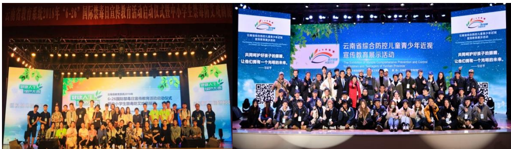
图片 1 引入真实项目开展跨专业联合实践教学，通过质量管理塑造“艺术·为人民服务”教学品牌

实践教学是艺术类专业人才培养的重要组成部分，是凸显专业特色和人才培养质量的重要环节。昆明城市学院艺术专业对标“应用型”人才培养目标和推动高等教育高质量发展的新要求，运用质量管理原则开展“跨专业联合实践教学”的质量管理，逐步形成“艺术·为人民服务”专业实践教学品牌。本文以“跨专业联合实践教学”中的质量管理为例开展分析。