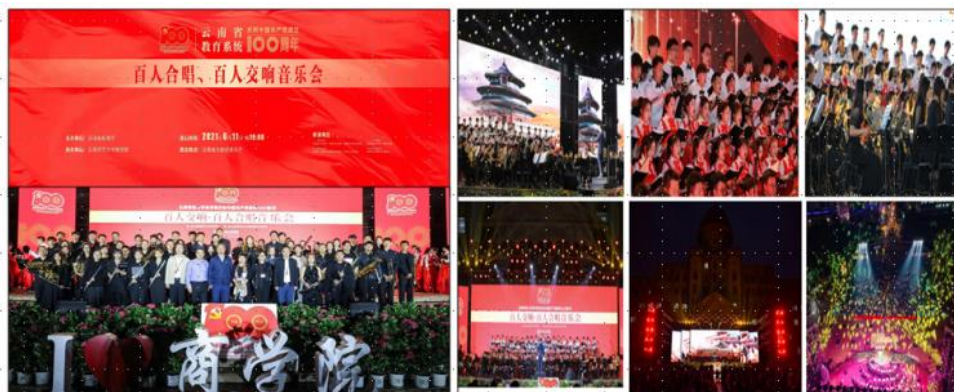
图片 3 跨专业联合实践教学中举行“庆祝中国共产党成立 100 周年暨百人交响·百人合唱音乐会”

2017年至2020年，学院将实践教学资源保障作为质量管理的阶段工作重心。引入真实项目彰显“艺术·为人民服务”品牌定位，保障实践教学资源。真实项目引领教学，培养符合“应用型”办学定位的合格人才。